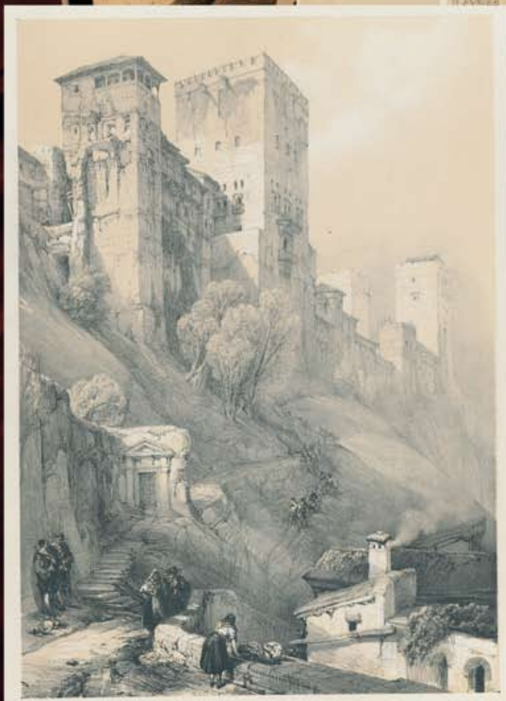
Fortaleza de la Alhambra. Granada