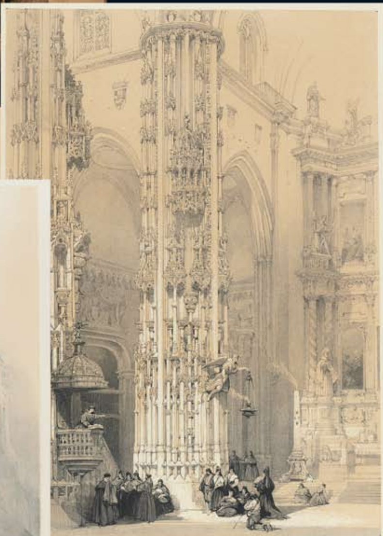
Iglesia de San Miguel, Jerez de la Frontera